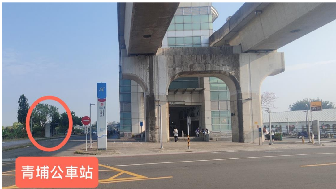
青埔站 1 號出口