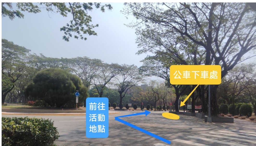
高雄科大(第一東校區)

高雄科大(第一)：紅 58B、97 與 7C 公車，下車站名：高雄科大(第一東校區)