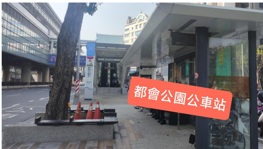
都會公園站 4 號出口

捷運都會公園站：由 4 號出口下車後轉公車[紅 58B 往燕巢區公所]、[97 往樹德科大]或 [7C 往高雄科大(燕巢)]