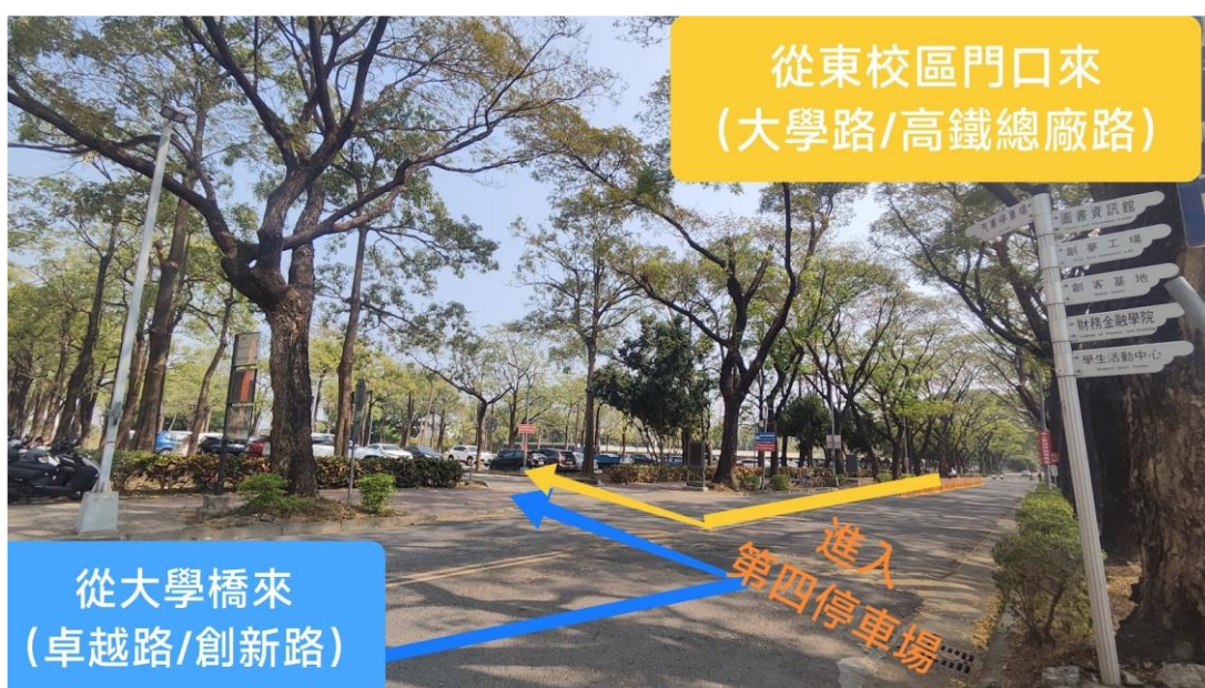
第四停車場路線圖